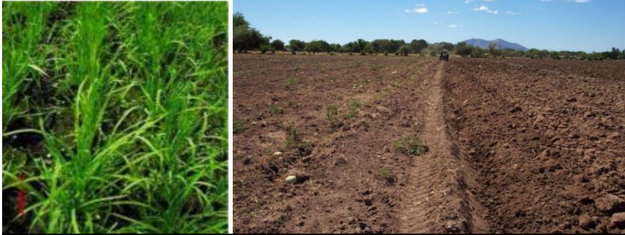
Figura 2. Plantación de arroz enmalezada y terreno recién preparado