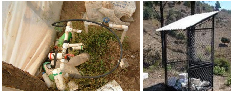
Figura 3. Envases de plaguicidas botados y recipiente recolector de envases de plaguicida en finca