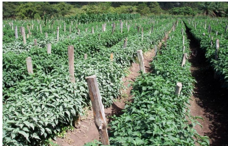
Figura 11. Aplicación de plaguicida con deficiente calidad de cobertura

El volumen de agua que se necesita para la aplicación depende la edad del cultivo, del nivel de incidencia de la plaga o la enfermedad y de la manera cómo funciona el producto a aplicar (contacto, ingestión o sistémico). En cualquier caso, es necesario realizar calibraciones para medir la cantidad de agua requerida. Se deben hacer tres o