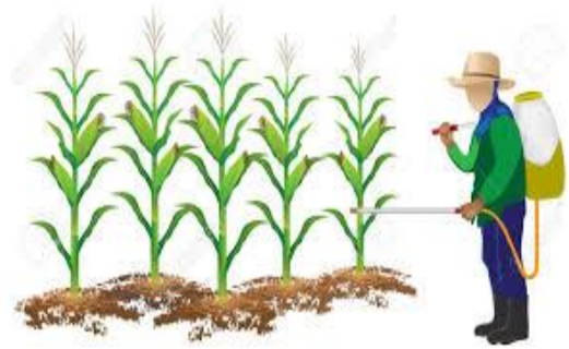
Figura 4. Aplicación de productos químicos

Los plaguicidas normalmente son de origen químico, pero en algunos pocos casos pueden ser de origen biológico o, inclusive, mineral. ¿Qué son los plaguicidas?, ante esta pregunta no debemos incluir solamente aquellas sustancias de origen químico, hoy en día se manejan muchos productos de origen vegetal, biológico y mineral.