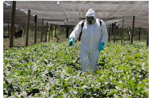
Figura 1. Traje de protección durante una fumigación

Son una serie de labores y actividades técnicas que se realizan en la finca durante todas las etapas del proceso productivo con el propósito de mejorar la calidad de la cosecha, la salud de los trabajadores, consumidores y del medio ambiente.