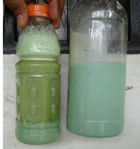
Figura 10. Envase con y sin sedimento en prueba de calidad de mezcla de plaguicidas

muestra de la mezcla en un envase pequeño (500 ml) por unos 15 a 30 minutos y si no ven ningún cambio en la temperatura y en la mezcla, probablemente no va a tener problema. Pero si ven un cambio, cambie la mezcla que lo mejor que puede pasar es que no funcione el producto y lo peor es que quemé el cultivo.