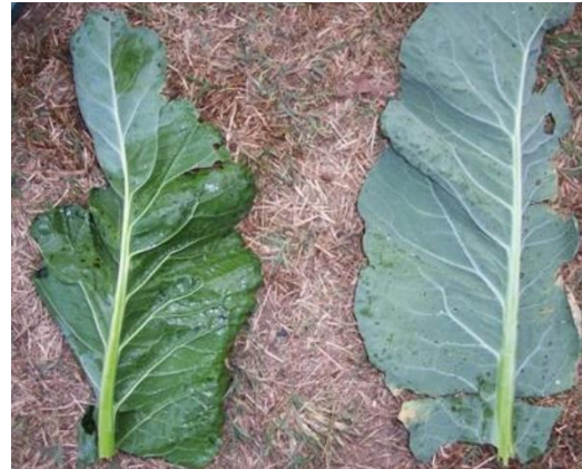
Figura 12. Calidad de humedecimiento en la hoja para mezcla con y sin adherente

El adherente es un producto que facilita la penetración de los productos para controlar plagas y enfermedades en las plantas, permitiendo una mejor dispersión de la mezcla de aplicación, independientemente de la dureza de las hojas. Debemos utilizarlo en todos los cultivos y no solo en épocas lluviosas sino también en épocas secas. Se usan de 1cc-2cc de adherente por litro de agua.