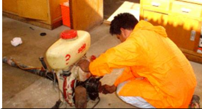
Figura 6. Preparación de equipo de aplicación de plaguicidas