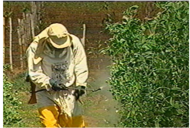
Figura 9. Aplicación de plaguicidas con protección personal en área de cultivo y zonas perimetrales

3. Reducción de Riesgos Ambientales: Algunas formulaciones pueden elaborarse para reducir el riesgo de escorrentía, evaporación o descomposición rápida, lo que disminuye la contaminación de fuentes de agua, suelo, y exposición a organismos benéficos. Elegir la formulación adecuada minimiza los impactos ambientales negativos.