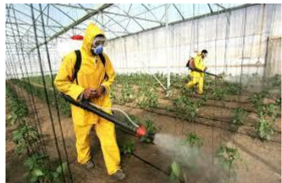
Figura 5. Aplicando insecticida