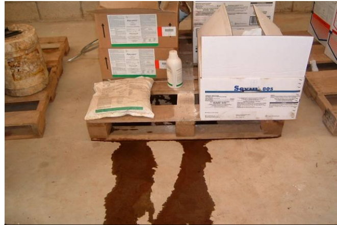
Figura 8. Plaguicidas ordenados pero con riesgo de contaminación por derrame