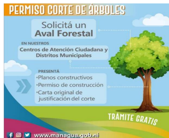
Figura 8. Página web alcaldía de Managua.