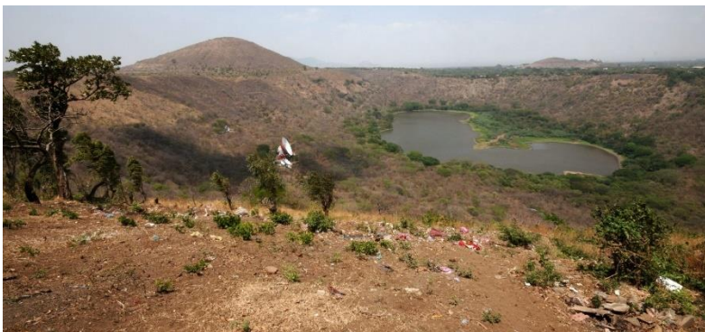
Figura 6. Escasez de agua debido a la deforestación cerca de los cuerpos de agua, Laguna de Nejapa.