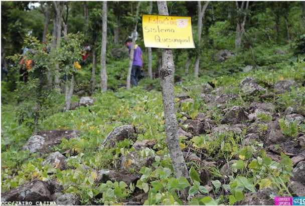
Figura 5. Promoción de sistema agroforestal Quesunqual, en condiciones de ladera.

7. Promoción de los planes de manejo a nivel de finca, bajo la metodología oficial del MARENA.