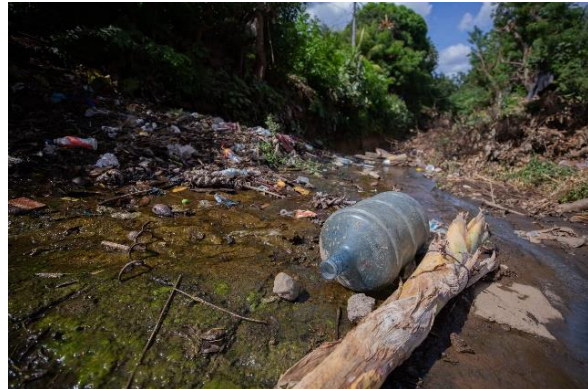
Figura 2. Contaminación por desechos sólidos.

Un conflicto ambiental también puede ser generado por efectos de la misma naturaleza y estos impactan de forma negativa sobre el ser humano. Este tipo de conflictos también pueden surgir cuando actores externos con un pensamiento desigual implementan proyectos a gran escala donde se disputan el control y acceso de los recursos naturales y no previenen el impacto que este puede generar en la localidades o ciertos sectores sociales.