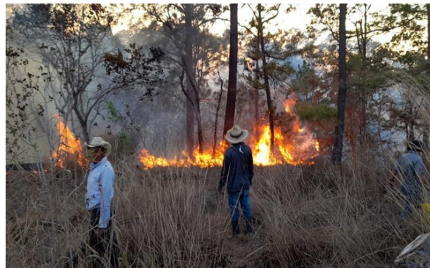
Figura 3. Quema en bosque de pino, Dipilto, NS.