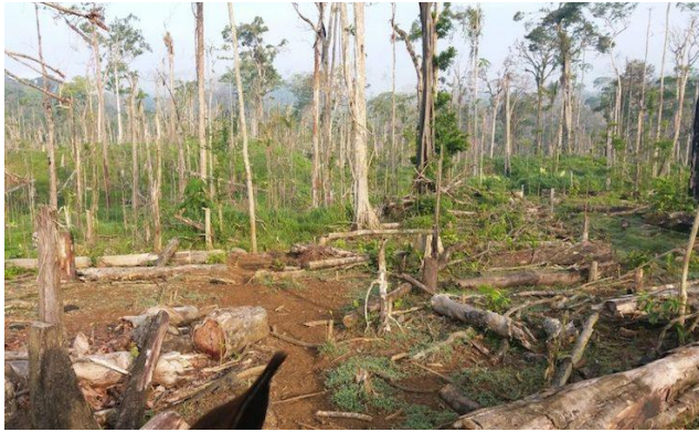
Figura 1. Deforestación cercana al Rio San Juan.

Los Recursos Naturales son fuentes de materiales que encontramos en la Tierra, los cuales son indispensables para los seres humanos ya que en su mayoría los productos que se fabrican provienen de estos bienes.