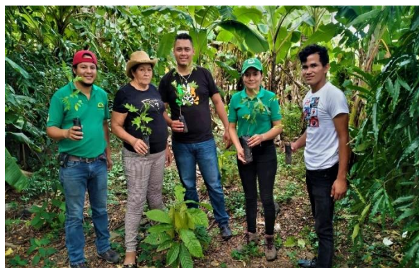
Figura 4. Campaña de reforestación "Verde te quiero verde"